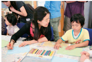
松川村の小学生(右)との異文化交流

8月29日(日) 対談「いわさきちひろ、平塚らいてう、母の想い」 主催：株式会社一兎社