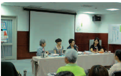
④国立中央図書館台湾分館にてちひろ展のシンポジウム