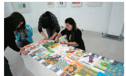
③1945年以降の代表的な日本の絵本も紹介(北京)