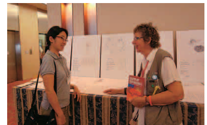
⑥広島原水爆禁止世界大会にてノルウェー代表と