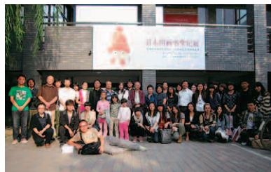
②北京中央美術院の学生らとともに