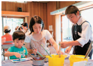
にじみづくりをサポートする松川村の中学生(右)

10月1日(金)～12月19日(日) 「ちひろの昭和」と伊藤まさこさんの 子ども服 協力：雑誌「ミセス」(文化出版局)