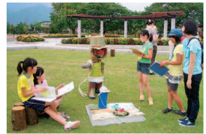
武蔵野美術大学の学生と、参加者の子どもたち

主催：2010安曇野まつかわサマースクール実行委員会 共催：松川村、武蔵野美術大学芸術文化学科、安曇野ちひろ美術館、安曇野アートライン推進協議会