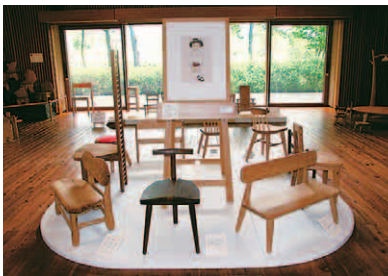
9名の作家がつくった「トットちゃんの椅子」

7月22日(木)～8月17日(火) 夏休み体験コーナー 「ちひろの水彩技法体験!」