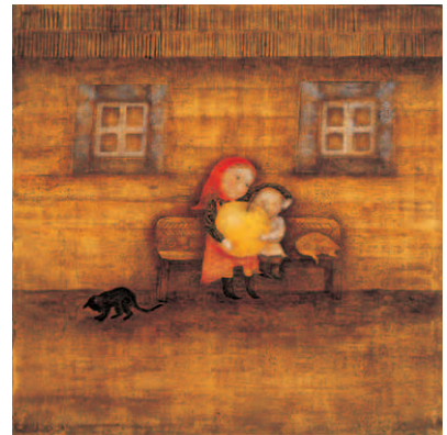
出久根 育『マーシャと白い鳥』(偕成社)より 2005年