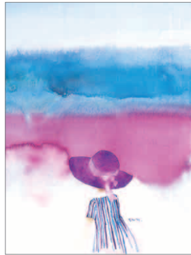
海を見つめる少女 1973年