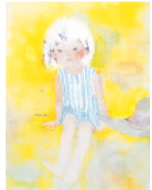
黄色い背景のなかにすわる少女 1969年