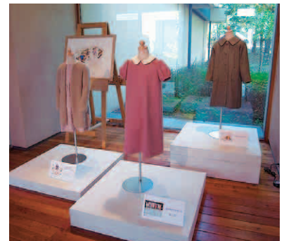
ちひろの絵からイメージしてつくられた服

10月1日(金)～12月19日(日) 「ちひろの昭和」と伊藤まさこさんの 子ども服 協力：雑誌「ミセス」(文化出版局)