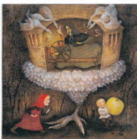
図1 出久根育(日本) 『マーシャと白い鳥』(信成社)より2005年

ほうきにまたがって空を飛ぶ魔女は、ファンタジーではおなじみの存在です。スラブの昔話に登場する魔女「ババヤガー」は、ほうきの代わりに臼に乗り、杵をオールのように使って空を飛びます。森の奥深くにあるババヤガーの住む小屋は、鶏の足の上に建ち、くるくると回転します。迷い込んだ子どもをとらえて食べるこの恐ろしい魔女の姿をさまざまな芸術家が想像を巡らせて描いてきました。2002年に日本からチェコへ移住して絵本制作に取り組んでいる出久根育は、テンペラと油彩を使ってババヤガーのいる情景を描いています。小屋の土台は、白く透ける鶏の羽が円形に重ねられ、ババヤガーが操る白い鳥や糸車と呼応して、縦や横に回転する不気味な動きを想像させます。暗い色調による細密な描写は、魔法の物語の緊張感をリアルに伝えています(図1)。