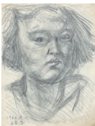
図1 自画像(27歳) 1946年

この年の5月、ちひろは党宣伝芸術学校に入学するために上京し、再び画家への道を歩み始めます。同年、人民新聞社に