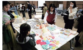
11/9 絵本育ちをテーマにしたシンポジウム