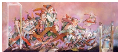
図3 ドゥジャン・カーライ(スロバキア) 『魔法のなべと魔法のたま』(ほるぷ出版)より1989年

『魔法のなべと魔法のたま』では、貧しい夫婦に繰り返し魔法の道具を授けるこびとが描かれています。出久根育も私淑するスロバキアの画家・ドゥジャン・カーライの絵筆は、まさに魔術のように、登場人物たちが重力から解き放たれたように勢ぞろいする場面を緻密に描き出しています(図3)。