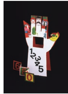
図5 クヴィエタ・パツオウスカー(チェコ) 数の物語 1990年