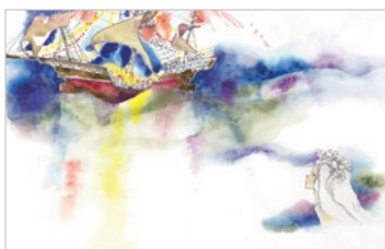
図4 船を見つめる人魚姫 『にんぎょひめ』(偕成社)より 1967年