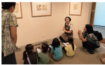
8/25 療育を必要とする親子を対象にした鑑賞会

験ワークショップを行った後、対話しながらいっしょに絵を見る時間を設けました。事前訪問で興味を持ってくれたこともあり、子どもたちは集中して参加することができました。プログラムを進めるにあたり、支援者が持参した残り時間がわかる「タイムタイマー」が役立ちました。自由観覧時間では、子どもたちがそれぞれに図書室や、おもちゃのある「こどものへや」、ショップも利用して、顔を輝かせながら美術館を楽しむようすが見られました。