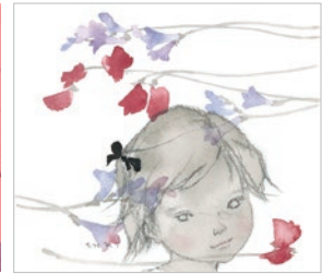
図3 スイートピーとフリージアと少女 1963年

1950年代から60年代にかけて、数多くの童話集が刊行され、ちひろも毎年のように童話集の仕事を手がけました。たくさん童話のなかでも「詩のようにことばの短く、うつくしく、いろいろなことを思いうかべることのできる」童画が好きと語っていたちひろは、人の世の悲しみや現実、心のひだを描き、時代や国境をも越えた普遍性を持つアンデルセンの童話に深く共鳴し、繰り返し絵本(図4)や単行本にも描きました。