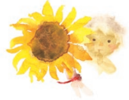
いわさきちひろ ひまわりとあかちゃん 1971年

本展では、ちひろが生涯描き続けたテーマ「子ども」に着目し、そこに込められた想いや背景を、ちひろの絵本や作品から紹介し、あらためて平和の意味について考える機会とします。