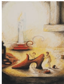
図2 バーナデット・ワッツ(イギリス) 『こびとのくつや』(西村書店)より1986年頃

ナデット・ワッツは、裸で靴をつくる善良なこびとをあたたかなろうそくの光で包むように描いています(図2)。