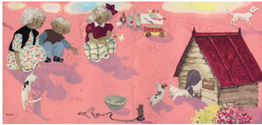
図2 「いぬのあかちゃん」 1953年

1950年、松本善明と結婚、翌年には長男・猛が生まれました。多忙を極めるなかでも、家族との暮らしや子育てを通し