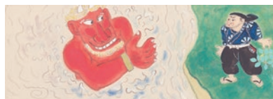
図4 赤羽末吉(日本) 『だいくとおにろく』(福音館書店)より1962年

日本の昔話にも、不思議な力を操る者が登場します。鬼はその代表的な存在といえるでしょう。『だいくとおにろく』では、ずるがしこくも間抜けな鬼が、だいくと取り引きをして、あっという間に流れの早い川に立派な橋をかけます。赤羽末吉は、民衆に語り継がれ、怖れられながらも愛されてきた鬼を大津絵のようなおらかな筆致で描きました(図4)。