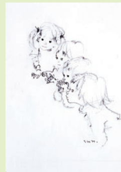
いわさきちひろ 見つめる子どもたち 1969年

CONTENTS 〈展示紹介〉いわさきちひろ「とても素朴なだけけれど たいせつなもの、それが絵本の中にはあるんです。」…②/ちひろ美術館コレクション 魔法の絵本=絵本の魔法…③/〈活動報告〉2025年度 InnovateMUSEUM事業…④/ひとことふたことみこと/美術館日記/新収蔵作品紹介④…⑤