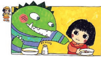
武田美穂『となりのせきのますだくん』(ポプラ社)より 1991年

本展では、大人気の『となりのせきのますだくん』をはじめ、リズムカルなことばで楽しく料理が進行する『オムライス・ハイ!』、作家・那須正幹の遺稿をもとに戦争と平和を見つめなおす『やくそく』などの原画とともに、絵本制作のための資料も展示し、多彩な表現と人気のひみつを探ります。