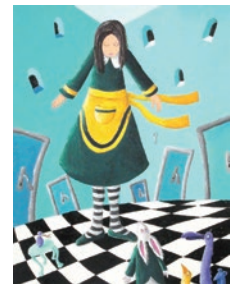
図6 アンドレア・ベトルリック・フセイノヴィッチ(クロアチア) 『不思議の国のアリス』より2002年

ノンセンスの魔法で非日常の世界へ旅に出てみませんか。よく知られているノンセンスの物語に「不思議の国のアリス」があります。クロアチアの画家、アンドレア・ベトルリック・フセイノヴィッチは、奇妙な世界に迷い込んだ少女・アリスをコントラストの強い色面と歪んだ空間のなかにとらえています(図6)。