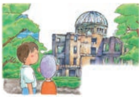
武田美穂『やくそく ぼくらはぜったい戦争しない』(ポプラ社)より 2025年