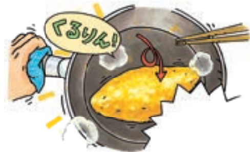
武田美穂『オムライス・ハイ!』(ほるぷ出版)より 2012年

吹き出し、オノマトペなど、斬新でありながら親しみやすい手法を用いた表現が魅力です。本展では、『となりのせきのますだくん』をはじめ、ラップ調のリズムによって調理する『オムライス・ハイ!』、戦争と平和をテーマにした『やくそく ぼくらはぜったい戦争しない』、最新作の『まるがかけたら』など、1991年以降の仕事のなかから代表的な絵本を紹介し、制作過程がわかる資料も展示し、子どもの心をとらえ続ける武田美穂の絵本づくりのひみつをさぐります。