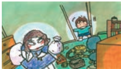
武田美穂『おかあさん、げんきですか。』(ポプラ社)より 2006年