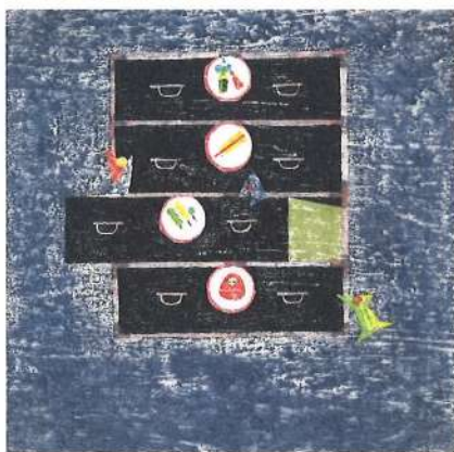
『もず』(至光社)より 1965年

童画、版画など多岐にわたる作品を制作し、生涯にわたってひとつの画風に留まることのない自由奔放ぶりで知られる初山滋。1919年、童話雑誌『おとぎの世界』の中心画家として表紙を担当し名声を得ます。その後も『コドモノクニ』や『未明童話集』など、子供向けの挿絵を多く手掛けました。1927年に武井武雄、岡本帰一とともに日本童画家協会を結成し、童画の分野を開拓します。戦争が近づき童画の仕事が減ると創作版画の制作を開始。「彫り進み」の技法による版画作品、私刊本となる手打絵本の制作にも力を注いでいきます。武井武雄に「独創的な初山イズム」と称された初山の世界をご紹介します。