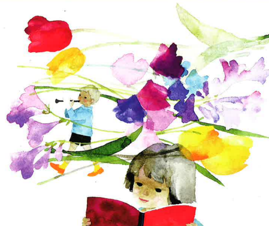
いわさきちひろ 笛を吹く少年と本を読む少女 1960年代前半