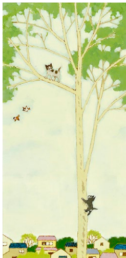
図3 『ぼくたちは子ネコ』(毎日新聞社)より 1974年

争が開戦し、戦争賛美の絵本が増えていくなかであって、動物画を得意とした安は『日本ムカシバナシ』(1942年)や『トリノエホン』(1943年、図2)などの良心的な絵本を発表しました。