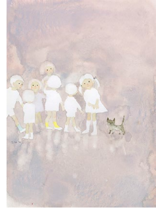
図5 猫と子どもたち 1969年

丸く、まだどこか、バランスが悪いさまは、彼らが保護されるべき存在であることを思わせると同時に、いじらしさを感じさせます。そこには、幼い子どもも既に一人の人間