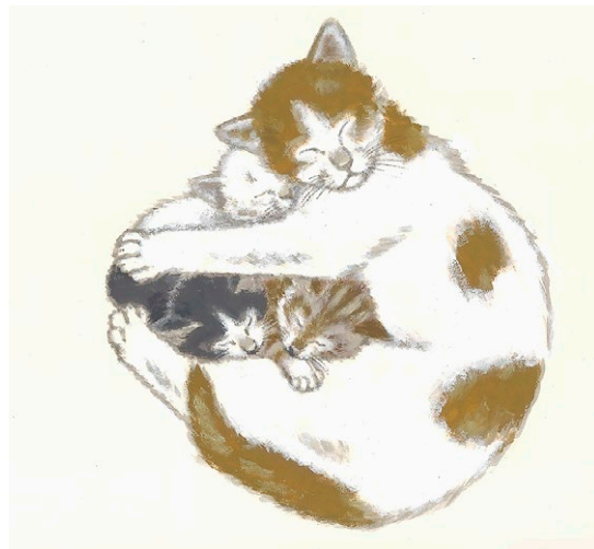
図4 『スイッチョねこ』(フレーベル館)より 1975年

その後も1964年には「児童出版美術家連盟(童美連)」の創立に参加し、画家の著作権擁護の運動に取り組むとともに、日本童画会の精神を引き継ごうと「童画ぐるーぷ車」をいわさきちひろや滝平二郎等と結成しました。自宅でデッサン会や童画の研究会を開くなど、後進の育成にも努めています。子どもの本の仕事に真剣に向き合い、仲間たちの中心で童画の発展のために活動しながら、その絵は常に穏やかであるところに、安の人間性が表れています。