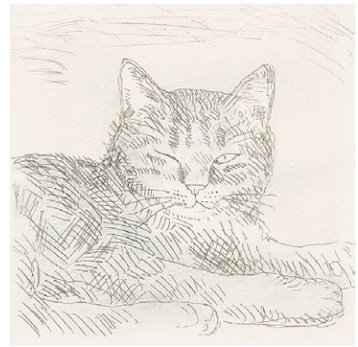
図2 和田誠『ねこのジジミ』より 1996年

拾われてきたねこの日常を描いた、和田誠の『ねこのジジミ』(図2)。主人公のねこはニードルを使ったエッチングの簡潔な線と色鉛筆の補彩によって表現されています。ねこの成長を間近で見ていた飼い主ならではの視点により、育っていくねこのしぐさや重さの変化が伝わ