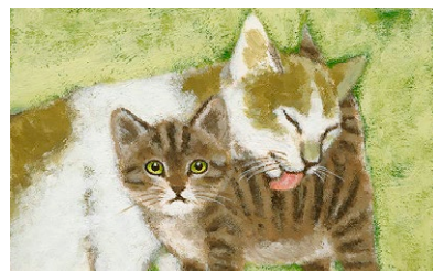
図5 ねこの親子 1970年代