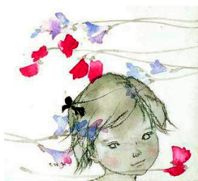
いわさきちひろ スイートピーとフリージアと少女 1963年

花と子どもの画家と称されるちひろの傍らにはいつも花がありました。花を愛で、心通わせる時間は、ちひろの創作も支えていました。本展では、「ちひろの庭」や「ちひろのアトリエ」、「ちひろの黒姫山荘」などの章に分けて、ちひろが描いた花々の作品を展示し、花に寄せた思いをさぐります。