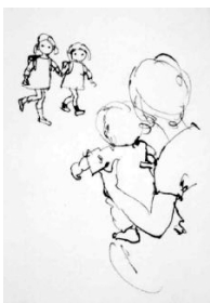
図3 あかちゃんの外出 1967年