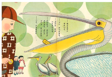
図1 ベリカン 絵雑誌「コドモノクニ」9巻9号(東京社)より 1930年(印刷物)

1930年代は日本が戦争へと突き進んだ時代でした。1937年に日中戦争が勃発すると、本格的な戦時統制がはじまり、子どもの本も戦意高揚に利用されていきました。プロレタリア童画運動ともいえる新ニッポン童画会は危険視され、1940年には安も検挙されて半年間警察に留置されるという経験をしています。1941年、童画家たちのグループは「日本少国民文化協会」に統合され、新ニッポン童画会も消滅を余儀なくされました。太平洋戦