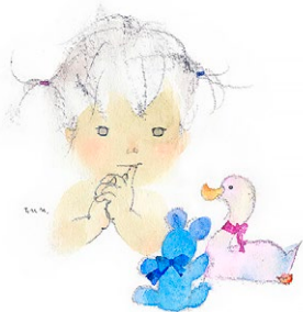
図1 アヒルとクマとあかちゃん 1971年

『枕草子』に「なにもなにも、ちひさきものはみなうつくし」、つまり、なにもかも、小さいものは愛らしい、と清少納言は千年以上前に書いていますが、人には、本能的に大きいものよりも小さいものをかわいいと感じる傾向があるようです。ちひろが描いたものには、小さいものを組み合わせているものが少なくありません。例えば 幼い子どもと、小さなぬいぐるみは、どちらも決して大きいものではありません。それらを一緒に描くことにより、それぞれの愛おしさも、より一層見るものに伝わるようです(図1)。