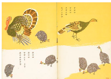
図2 絵本『トリノエホン』(富士屋書店)1943年(印刷物)

争が開戦し、戦争賛美の絵本が増えていくなかであって、動物画を得意とした安は『日本ムカシバナシ』(1942年)や『トリノエホン』(1943年、図2)などの良心的な絵本を発表しました。