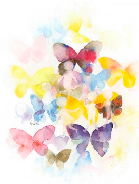
図6 蝶と子どもたちの幻想 1970年

あたたかくなった春の庭を飛びまわる蝶は、希望のシンボルのようにも見えます。ちひろは、そんな蝶をたびたび絵に描いています。複数の蝶を画面に散らばらせることによって、まるで花畑のような華やかさが表現されます(図6)。