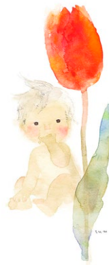
図2 チューリップとあかちゃん 1971年