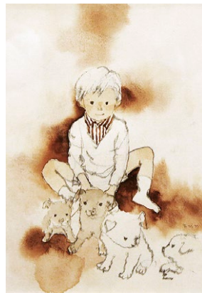
図4 小犬と少年 1968年

犬にはさまざまな種類が存在しますが、ちひろが描く犬はどことなくみな似ています。耳は短く、毛はあまり長くはありません。本人が語った雑種なのでしょうか。いずれも成犬より子犬で、子どもたちを見守り、一緒に遊んでいる仲間のようなようです(図4)。