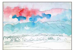
いわさきちひろ 松川村スケッチ 「神戸原より田園風景をのぞむ」1950年頃