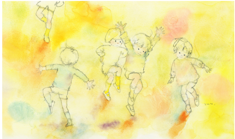
いわさきちひろ 「このあしたん」1969年