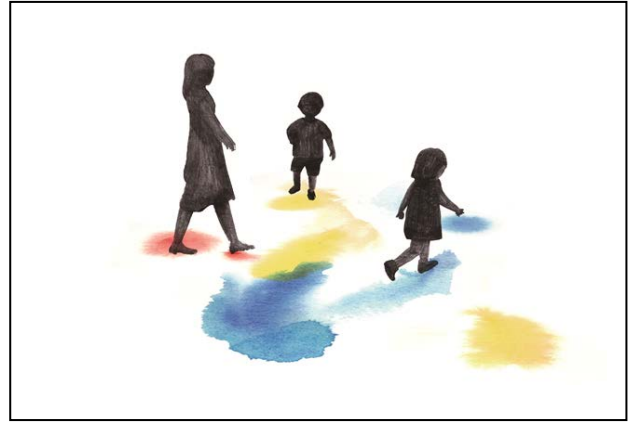
plaplax 新作インスタレーション作品のイメージ

ちひろが子どもの心になりきって楽しみながら描いた絵本『ぼちのきたうみ』など3冊の絵本をテーマに、絵本とあそびが融合した「絵を見るための遊具」をplaplaxが制作します。のぞいたり、のぼったり、くぐったり、体をいっぱいに使ってちひろの絵本の世界観を楽しみます。