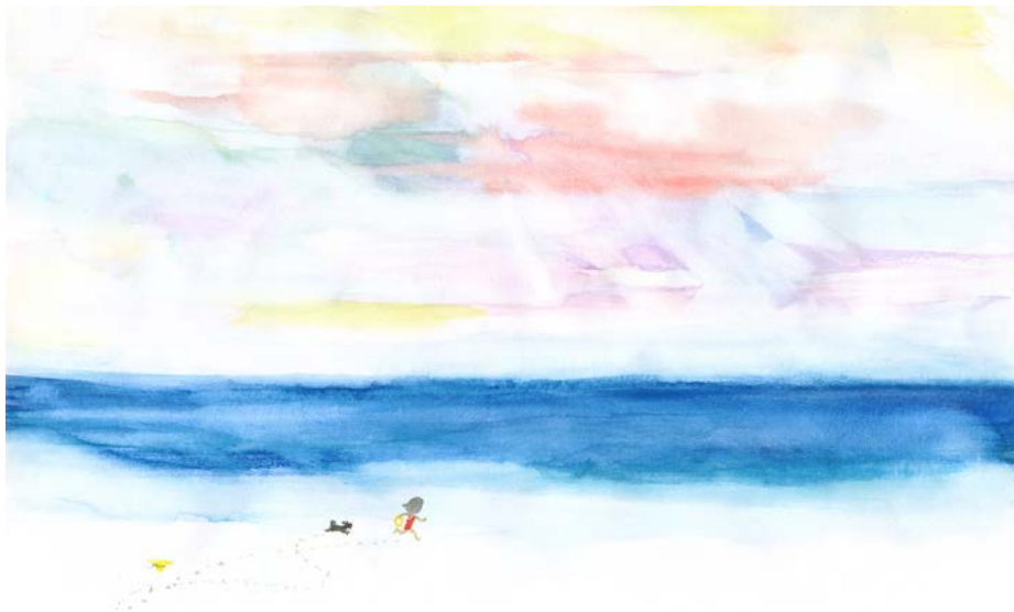
いわさきちひろ 海辺を走る少女と子犬 1973年

ちひろが子どもの心になりきって楽しみながら描いた絵本『ぼちのきたうみ』など3冊の絵本をテーマに、絵本とあそびが融合した「絵を見るための遊具」をplaplaxが制作します。のぞいたり、のぼったり、くぐったり、体をいっぱいに使ってちひろの絵本の世界観を楽しみます。