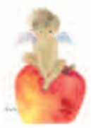
いわさきちひろ 「りんごの天使」1964年