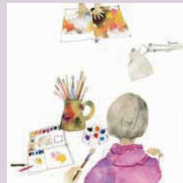
9 アトリエの自画像 『わたしのえほん』(みどり書房/新日本出版社)より 1969年

戦争体験や夫との出会い、母親であり画家である自身の暮らしを絵と文でつづったちひろの自伝的な絵本『わたしのえほん』を通して、ちひろの人生をたどります。