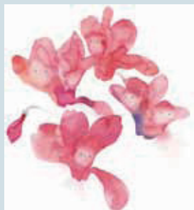
7 シクラメンの花のなかの子どもたち 『戦火のなかの子どもたち』(岩崎書店)より 1973年

ちひろは、生涯に戦争をテーマにした3冊の絵本を手がけています。広島で被爆した子どもたちの詩や作文に絵をつけた『わたしがちいさかったときに』、ベトナム戦争をテーマにした『母さんはおるす』と『戦火のなかの子どもたち』、どの絵本にも子どもの命を脅かす戦争を許さない、強い反戦の願いが込められています。