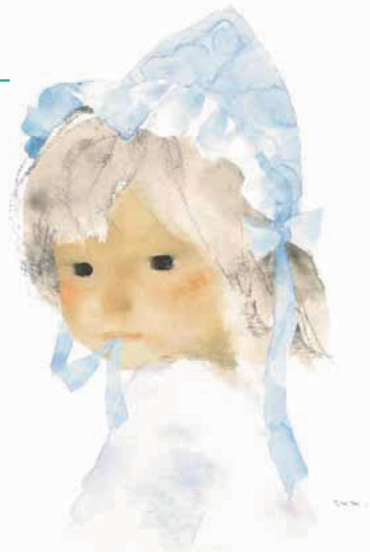
6 あかちゃんのくるひ 『あかちゃんのくるひ』(至光社)より 1969年