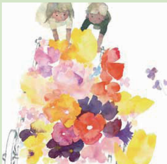
8 はなぐるま 1967年

「子どもは全部が未来」と語ったちひろ。ちひろにとって子どもはかけがえのない命そのものでした。ちひろが描くしなやかな子どもやあかちゃんの姿には、母親としてのあたたかなまなざしを感じられます。