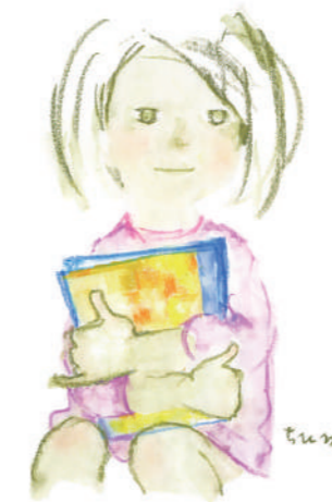
いわさきちひろ ほんをかよふ少女 1970年

どちらの図書館も、祝休日が休館日にあたるときは開館し、直後の祝休日でない日が 休館日になります。年末年始(12月29日～1月4日)は休館となります。