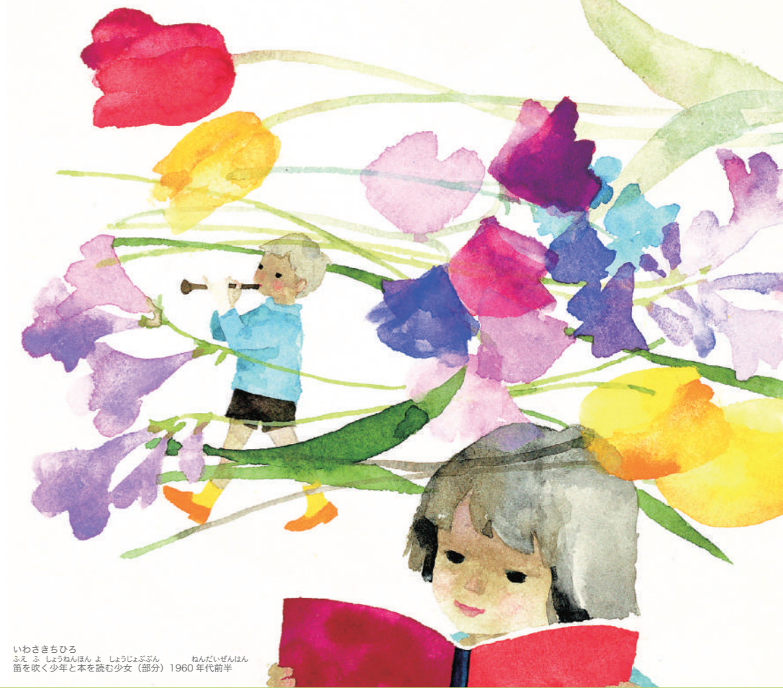
いわさきちひろ ふえふしやうねんほんよ 笛を吹く少年と本を読む少女(部分) 1960年代前半